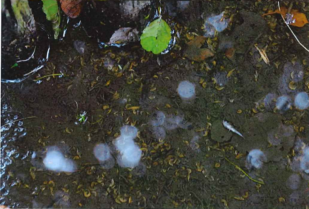
Importante mortalité de poissons (truites en photos ci-dessus) et de macro-invertébrés (gammarés en photo ci-contre) observée sur le Bocq le 02 septembre 2017 à Achet